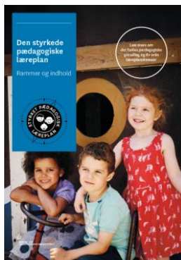
Den styrkede pædagogiske læreplan. Rammer og indhold

Denne skabelon indeholder alle de lovmæssige krav til evalueringen. Lovkravene finder I i de to midterste afsnit "Evaluering og dokumentation" og "Inddragelse af forældrebestyrelsen". Skabelonen indeholder desuden spørgsmål, som kan støtte jeres evalueringsproces samt jeres fremadrettede arbejde med løbende at revidere den skriftlige læreplan.